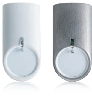
In verschiedenen Designcovern erhältlich: der Bewegungsmelder comstar VAYO.

Ein weiterer Vorteil der TELENOT-Alarmanlage: Sie ermöglicht die Scharfschaltung einzelner Räume oder Raumbereiche, sodass die Anlage bei Anwesenheit aktiviert werden kann. Insofern kann auch nach Geschäftsschluss weiter gearbeitet werden.